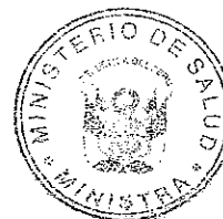
MIDORI DE HABICH ROSPIGLIOSI Ministra de Salud