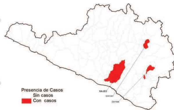
Casos acumulados 2019*