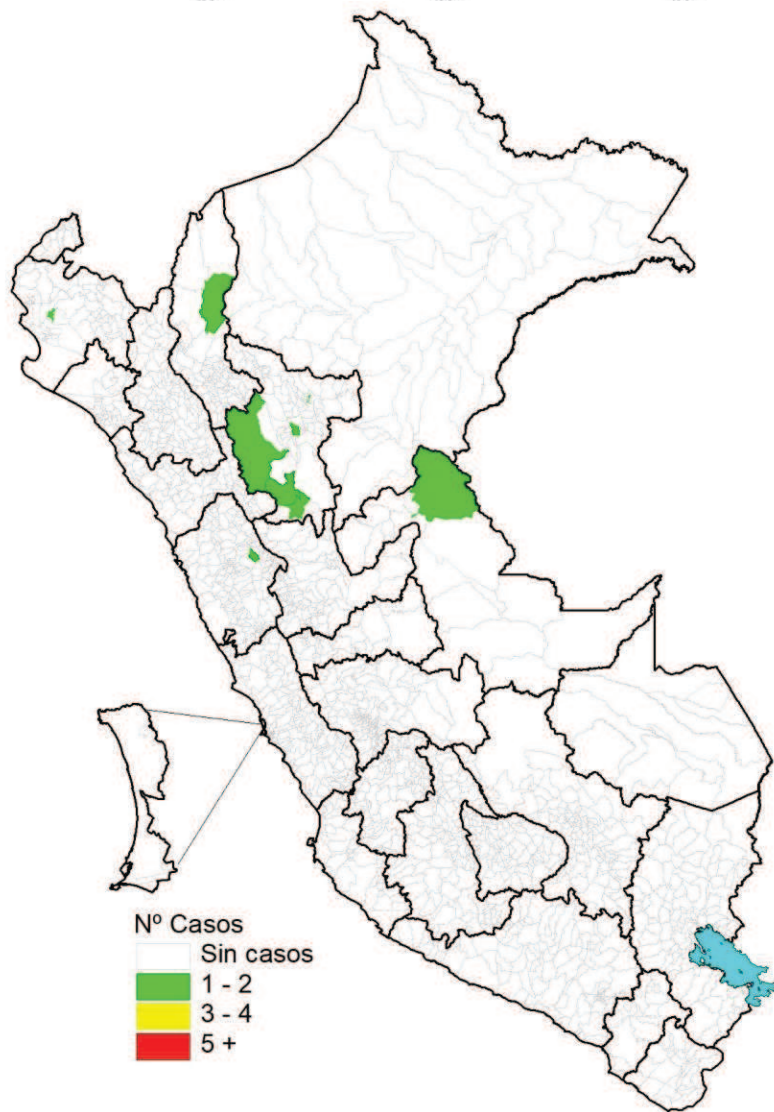
Mapa de riesgo en la SE 14 - 2019