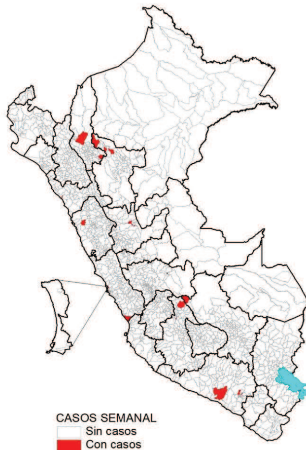
Casos en la SE 14 - 2019

En la SE 14 - 2019, son 21 distritos distribuidos en 15 provincias de 9 departamentos que registran casos de loxocelismo .