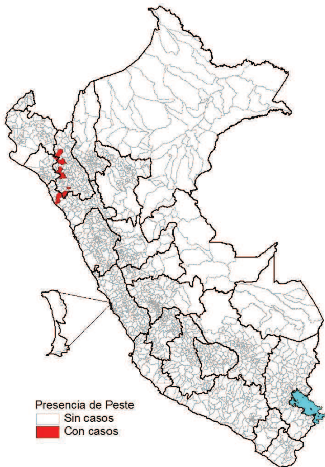
Casos acumulados 2012-2018

Desde el 2012 hasta el 2018, 14 distritos al menos con un caso de peste.