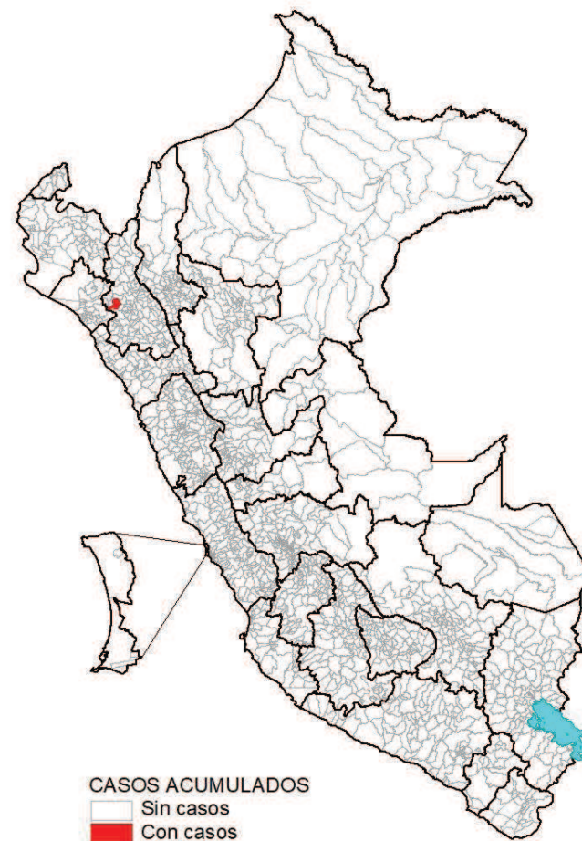
Casos a la SE 14 – 2019*

Hasta la SE 14 – 2019 se registra 1 caso de peste.