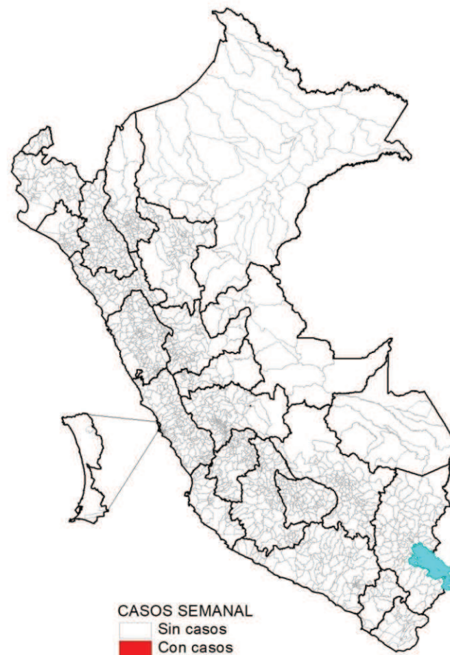
Casos en la SE 14 - 2019*

Durante la SE 14 no se registro casos de rabia probables.