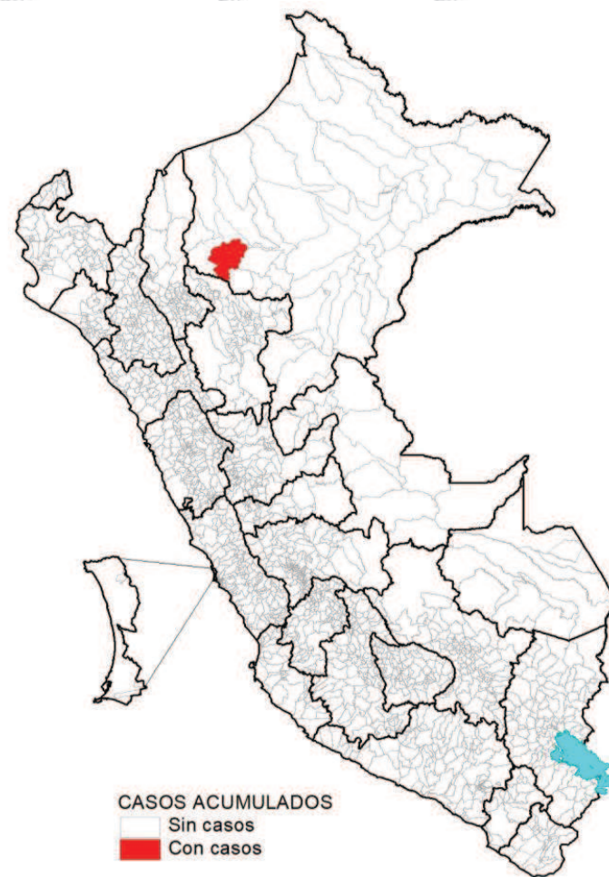
Casos en la SE 09 – 2020*

Desde la SE 01 a la SE 09 – 2020 se registran 1 caso de rabia.