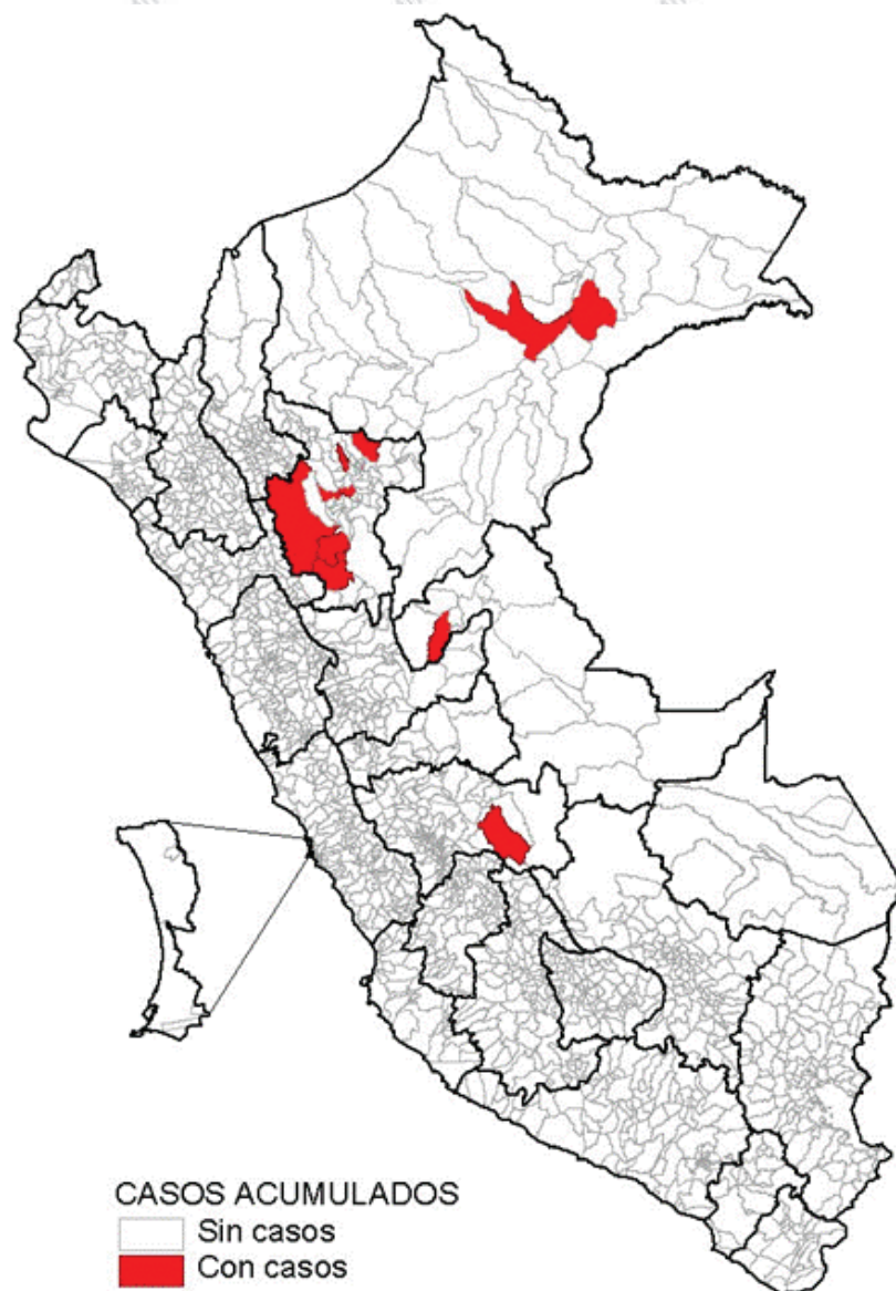
Mapa de riesgo en la SE 22 - 2020