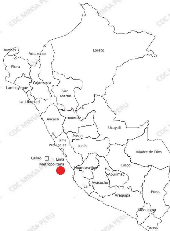
Casos acumulados 2020*

Desde la SE 01 a la SE 44 - 2020, sólo 1 región ha reportado al menos dos casos probables de meningitis meningocócica.