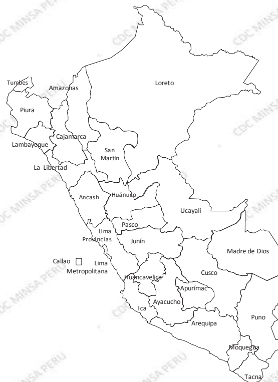
Casos en la SE 44 2020

En la SE 44 son 0 distritos distribuidos en 0 provincias de 0 departamentos que no registran casos de meningitis meningocócica