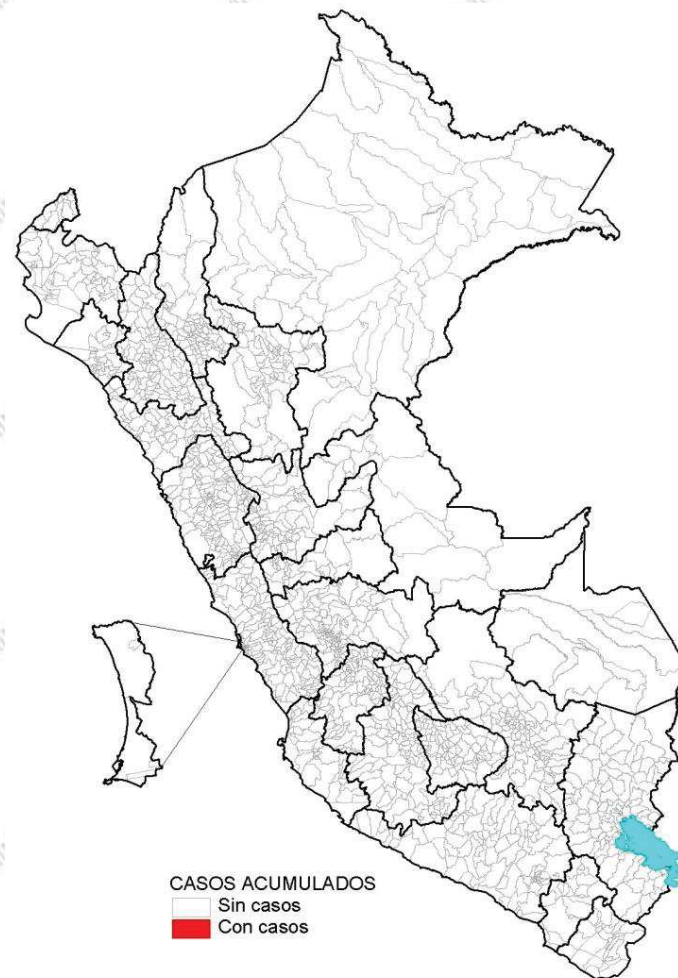
Casos a la SE 35 – 2021*

En la SE 35 – 2021 no se registraron casos de carbunco.