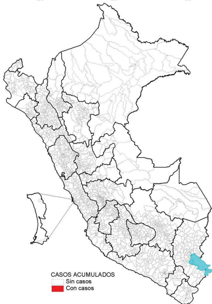
Casos acumulados al 2021

Desde la SE 01 a la SE 35 del 2021, no se han notificado casos de carbunco.