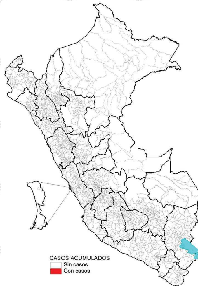
Casos durante la SE 45 - 2021

Durante la SE 45 - 2021 no se registraron casos de carbunco.