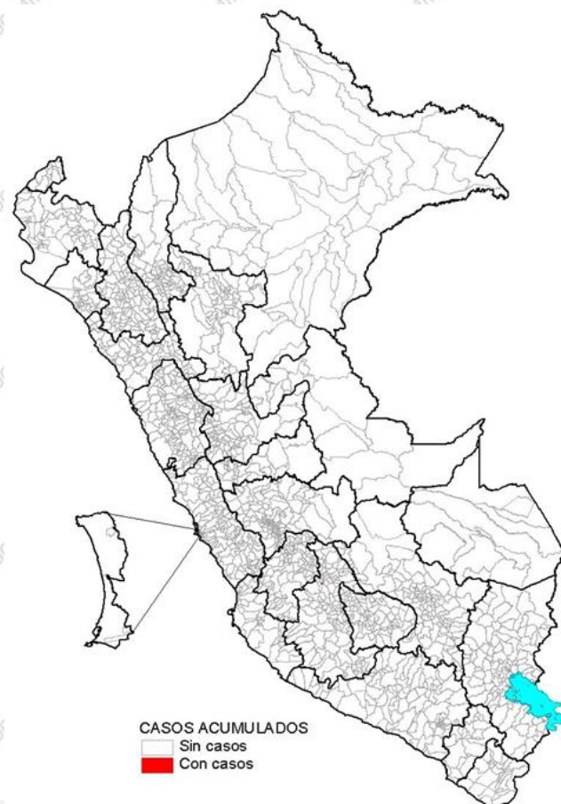
Casos a la SE 19 – 2022

Hasta la SE 19 – 2022, no se registraron caso de carbunco.