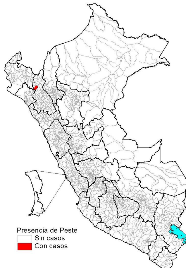
Casos a la SE 36 – 2023

En la SE 36 – 2023, no se notificaron casos de peste.