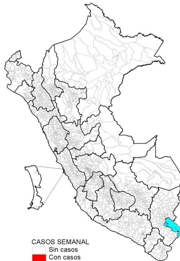
Casos en la SE 14 - 2025

En la SE 14 – 2025, no se registra distritos con casos de Enfermedad de Chagas.