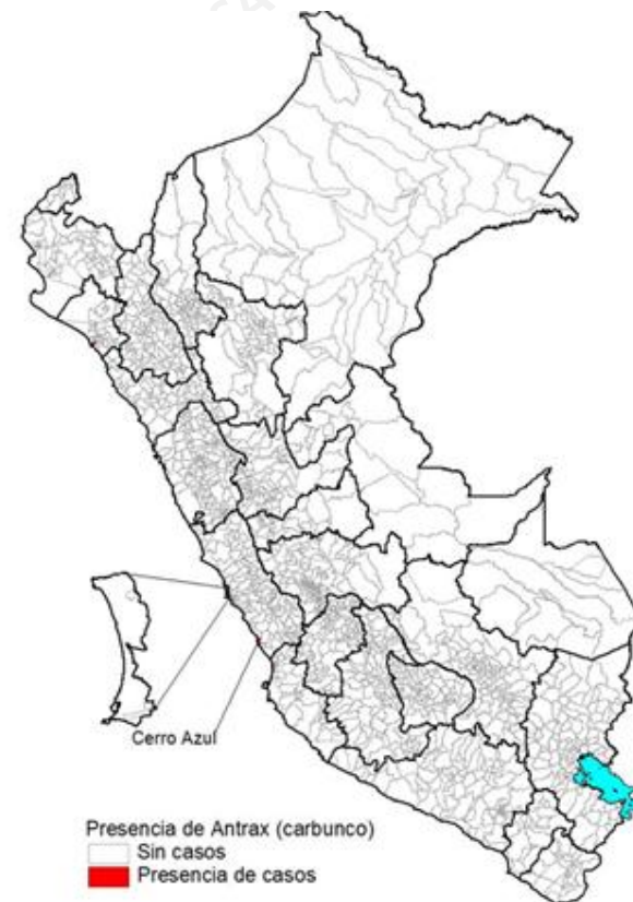
Casos a la SE 52 – 2025

Hasta la SE 52 – 2025, se notificaron 6 casos de carbunco.