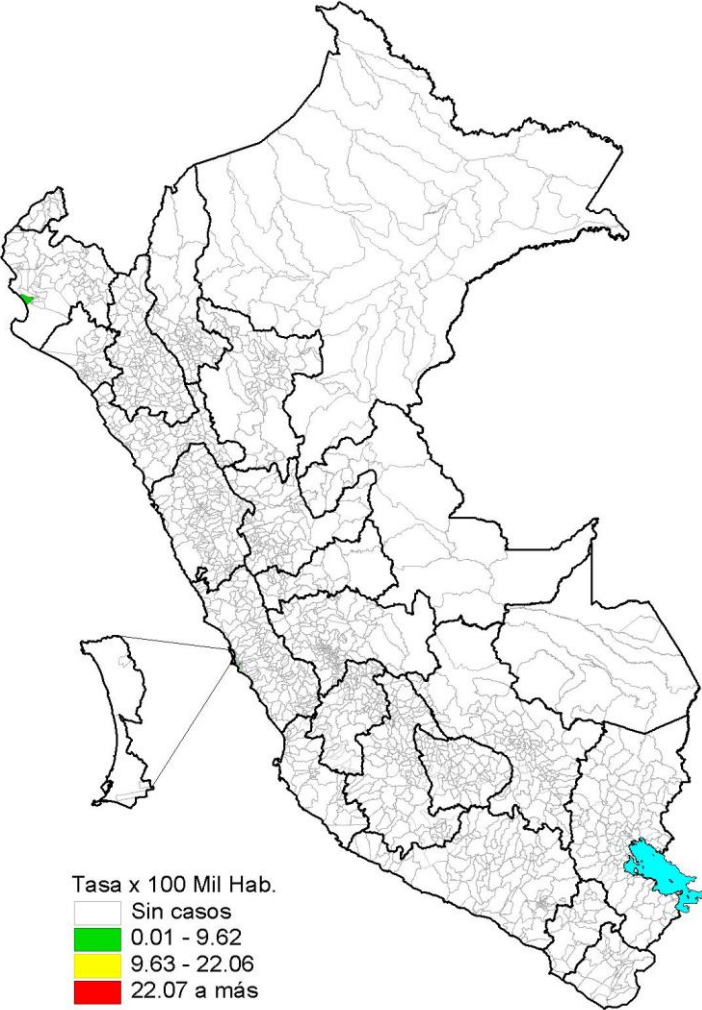
Incidencia acumulada 2025